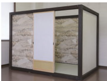
スタンダードタイプ外観